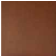
hematite rust rouille hematite