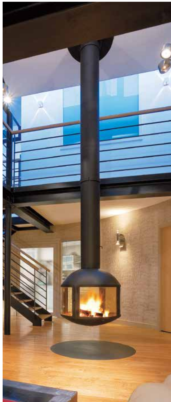
Agorafocus 850 ©