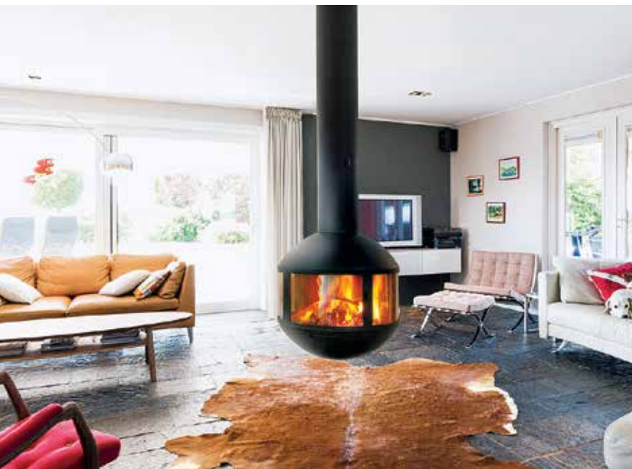
Agorafocus 630 ©