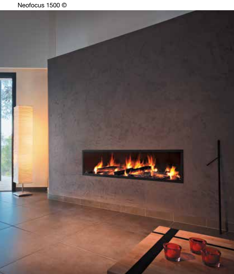
Neofocus 1500 ©