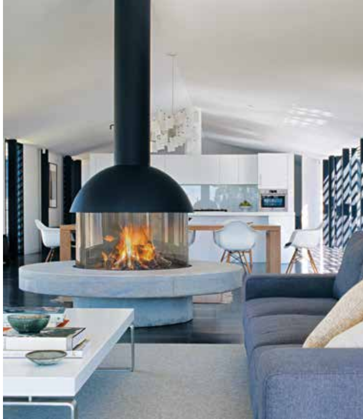
Hotte vitrée de Mezzofocus ©