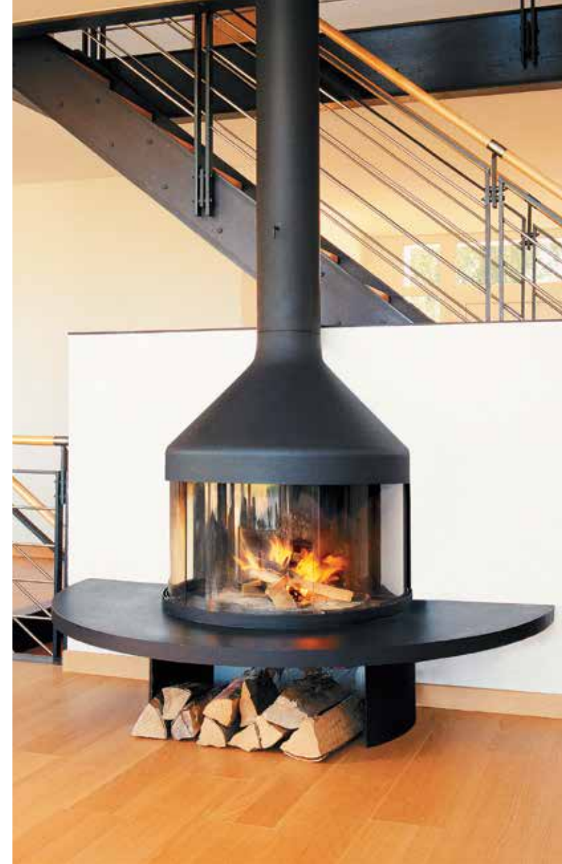
Optifocus 1750 ©

Cheminée centrale avec verres coulissants - Ø 0,865 m.