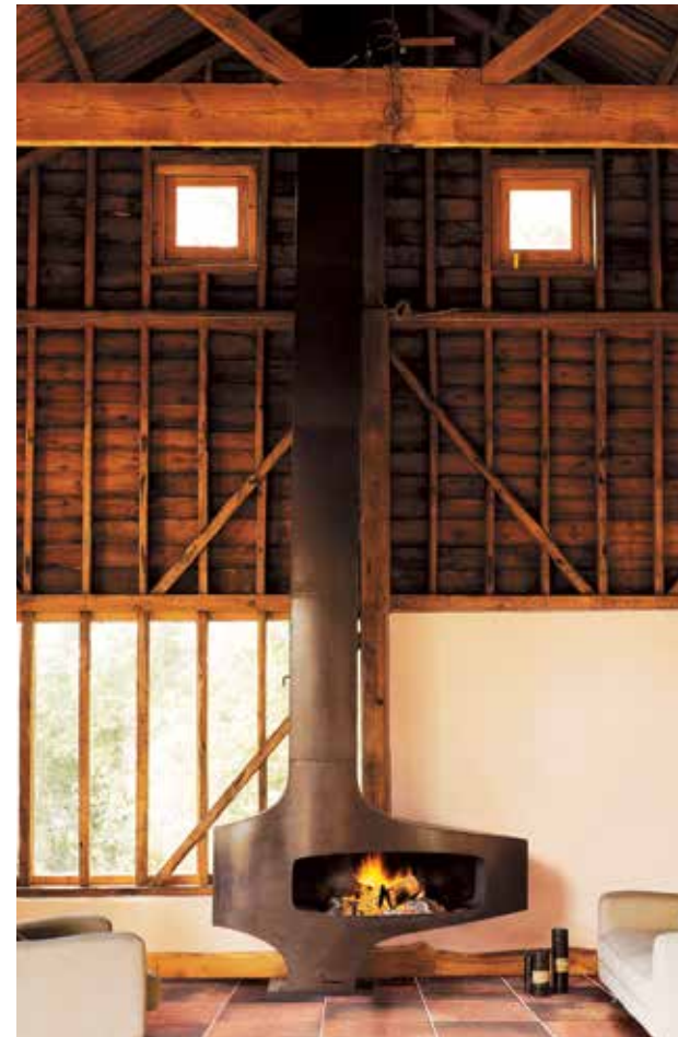
Hétérofocus 1400 ©