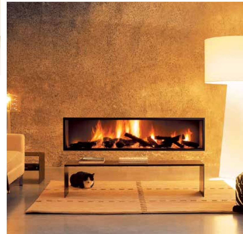
Neofocus 1500 ©

- fil du vent et de la nuit, le feu - Cheminée murale avec pare-étincelles - L : 1,40 m.