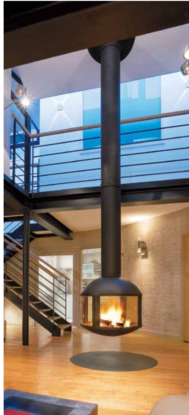
Agorafocus 850 ©

- des feux à lire à pleines mains - Cheminée centrale au foyer vitré - Ø 0,85 m. Commercialisée uniquement aux États-Unis.