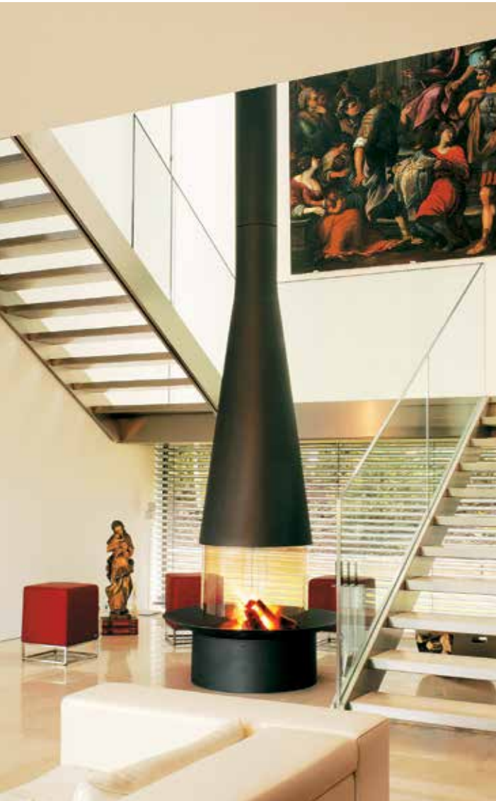
Central Filiofocus 2000 / Filiofocus central 2000 ©