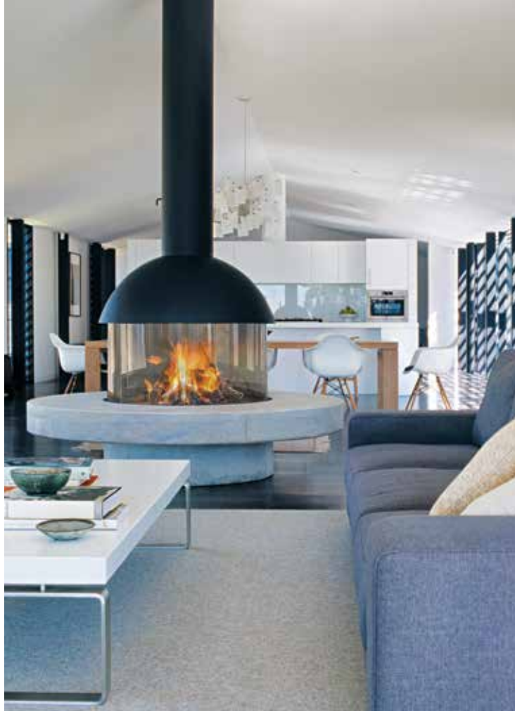
Hotte vitrée de Mezzofocus ©