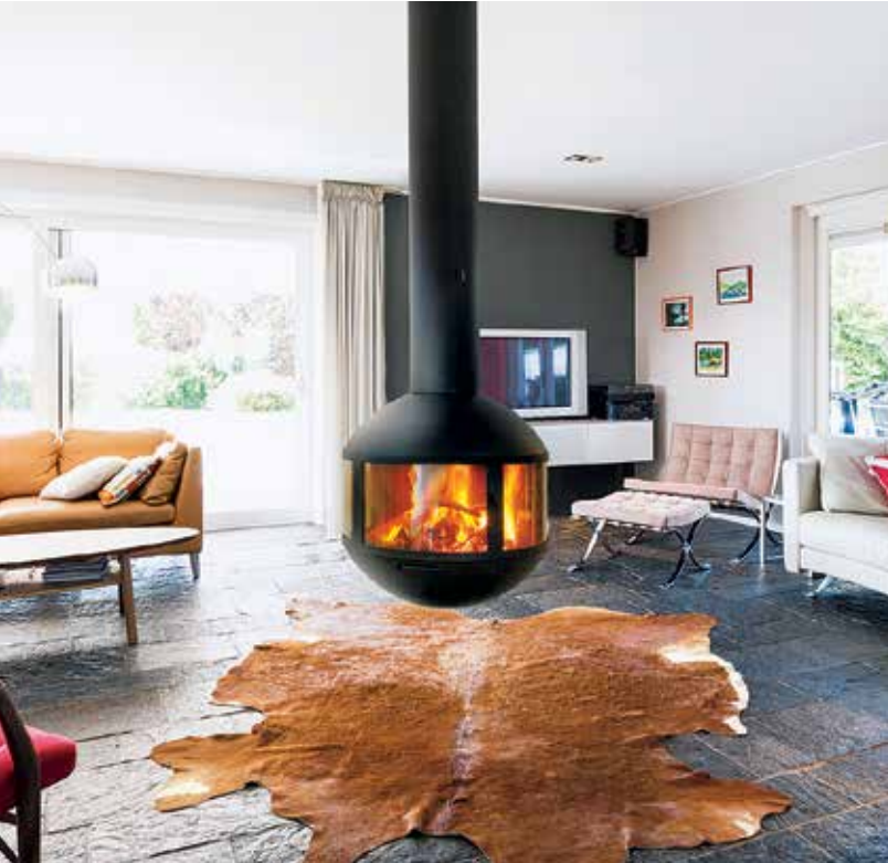
Agorafocus 630 ©

- phare intime - Cheminée centrale au foyer vitré - Ø 0,63 m. Commercialisée uniquement aux États-Unis.